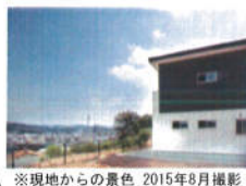
※現地からの景色 2015年8月撮影