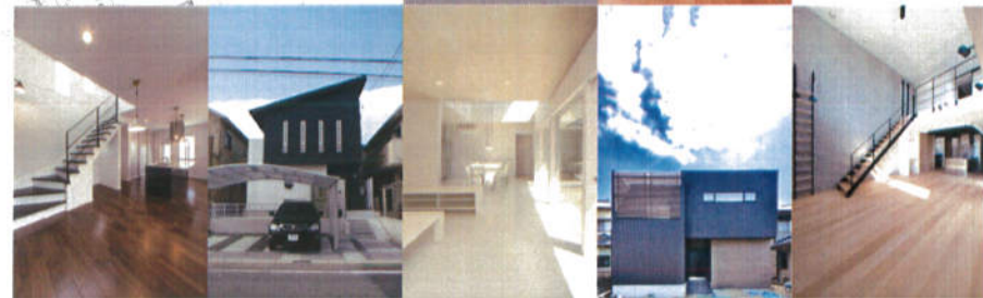
※写真は当社施工事例です