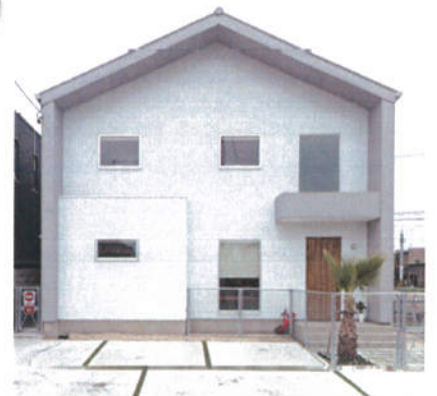
写真は当社施工例で見学会場と異なります。