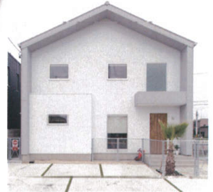
写真は当社施工例で見学会場と異なります。