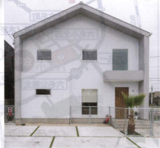
写真は当社施工例で見学会場と異なります。